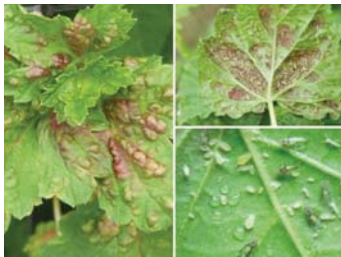
Тля на смородине